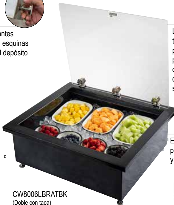
CW8006LBRATBK (Doble con tapa)