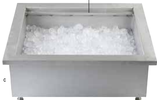
CW8006BRATCL (Doble sin tapa)