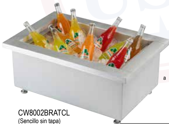
CW8002BRATCL (Sencillo sin tapa)