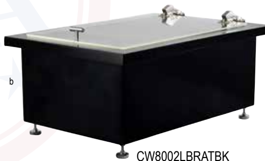
CW8002LBRATBK (Sencillo con tapa)